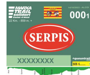
Exemple de dorsals amb el logotip dels patrocinadors d'equip